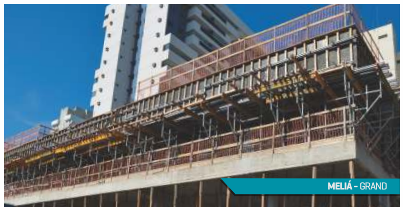
MELIÁ - GRAND