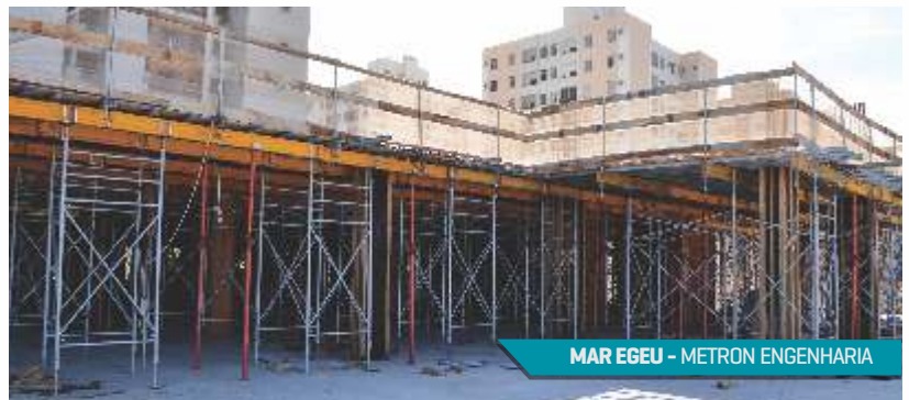
MAR EGEU - METRON ENGENHARIA