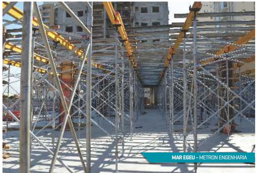
MAR EGEU - METRON ENGENHARIA