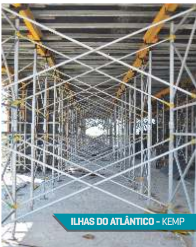
ILHAS DO ATLÂNTICO - KEMP